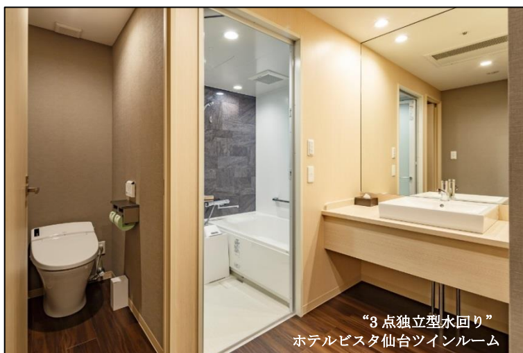
“3点独立型水廻り” ホテルビスタ仙台ツインルーム

ホテルビスタの魅力のひとつは、バスルームとトイレ、洗面台がそれぞれ別に設置されていることです。2006年のホテルビスタ札幌[中島公園]の開業を皮切りに、札幌[大通]、東京[赤坂]、海老名、名古屋、京都・和邸、大阪・本町/なんば、広島、熊本空港で全室、大浴場付きの仙台、金沢、福岡では一部でこの3点独立型水廻りを実現しています。日本人の生活習慣に合った客室設計と、地域密着型のホテル作りがお客様の支持を得て、大手オンライントラベルエージェントの口コミ評価に加え、リピーター比率も高いのが特長です。