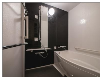
洗い場付きバスルーム