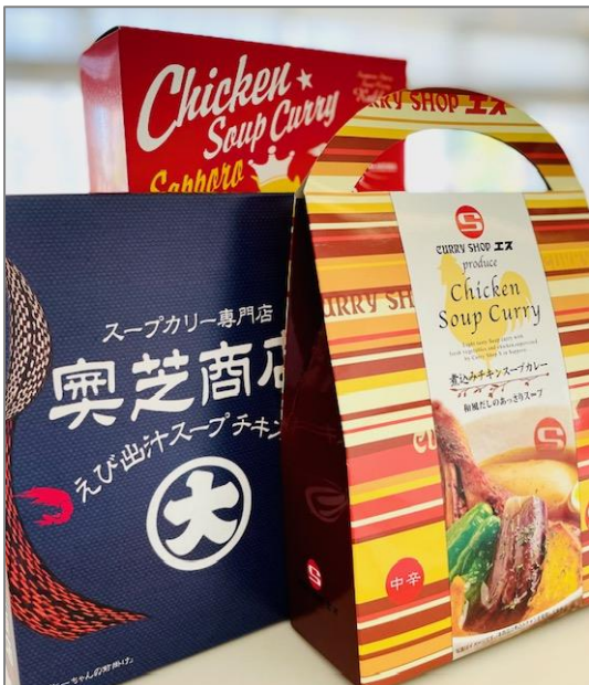
一例：カレーショップエス、奥芝商店

札幌名物のひとつであるスープカレー（ごはん付き）をお部屋で楽しめるプランです。有名店のレトルトスープカレーの中から好きなものを選べます。スタッフも試食しましたが、さすが有名店だけあってレトルトとは思えない一品です。外食する時間の取れない方や、自身へのお土産として自宅で楽しみたい方にお勧めです。