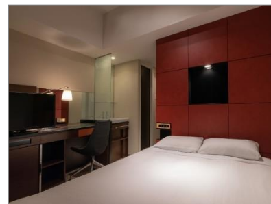
セミダブルルーム （オーセンティックタイプ）