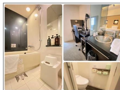
シングルを含む全室でお風呂・ トイレ・洗面が分かれた水回り を採用