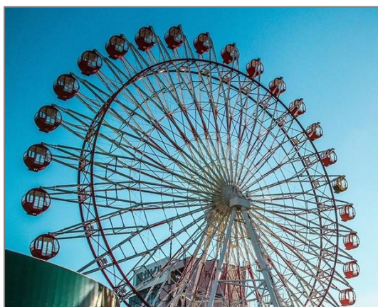
ノルベサの観覧車「ノリア」

何と云ってもおすすめは、北九州市、長崎市と共に日本新三大夜景都市のひとつに選ばれた札幌市の夜景です。札幌初の屋上観覧車に乗ってあなただけの景色を眺めてみませんか。北海道は季節毎に違った顔を見せることから、乗るたびに新たな発見があるかもしれません。