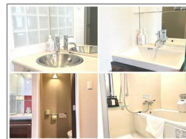
シングルを含む全室でお風呂・ トイレ・洗面が分かれた水回りを採用