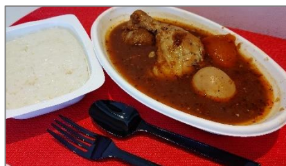
レトルトご飯、容器付き