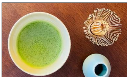
客室には茶器を準備しています。

京都では、地元の人にも人気の高い“一保堂茶舗”のほうじ茶ティーバッグ、抹茶が付いた宿泊プランです。一保堂茶舗は、創業1717年の老舗でお茶がおいしいことで有名です。店舗もホテルから徒歩10分程度と近いことからゲストをご案内することもあります。客室には、茶碗と茶筌をご用意していますので抹茶を点ててお茶の本場京都の雰囲気を楽しむことができます。