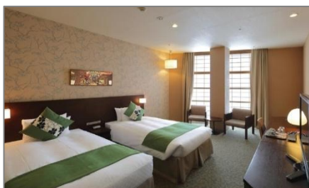
デラックスツインルーム