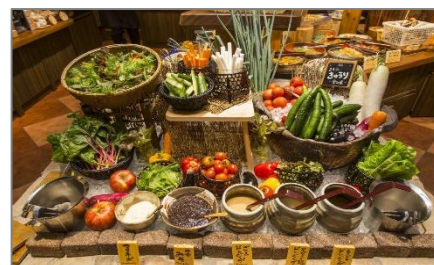
元気になる農場レストラン モクモク