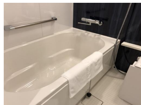
全室洗い場付きバスルーム完備