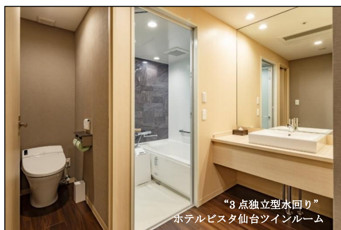
“3点独立型水回り” ホテルビスタ仙台ツインルーム

加えて、ホテルデザインにも地域の文化や伝統工芸の要素を取り入れ、朝食には地元ならではのメニューや、食材を活用するなど、チェーンホテルでありながら、個性を持ったホテル作りをしています。このように日本人の生活習慣に合った客室設計と、地域密着型のホテル作りがお客様の支持を得て、大手オンライントラベルエージェントの口コミ評価が高いのが特長です。