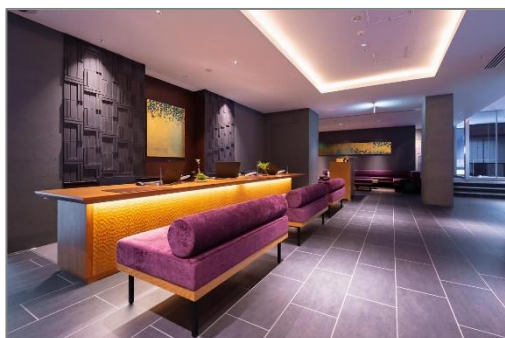
チェックインは座ったままで