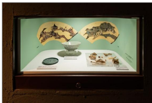
ホテル建設時の出土品を展示