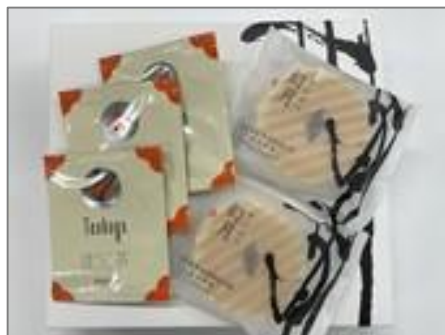
一保堂茶舗のほうじ茶ティーバッグと然花抄院の幻月

京都では、地元の人にも人気の高い“一保堂茶舗”のほうじ茶ティーバッグに、スタッフおすすめ然花抄院（ぜんかしょういん）の有名菓子【幻月】（げんげつ）の付いた宿泊プランです。ほうじ茶に合う京都ならではの お菓子をスタッフで厳選したのですが、満場一致で幻月が選ばれました。