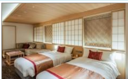
ビスタツインルーム