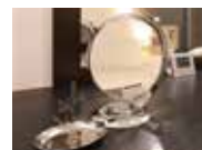
レディースルーム 専用の備品