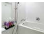
浴室・トイレ・洗面台は 独立仕様