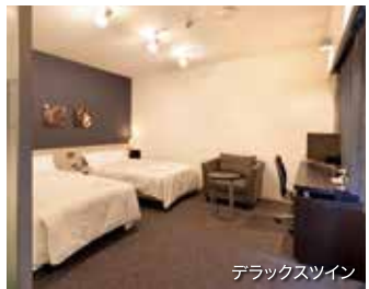
デラックスツイン