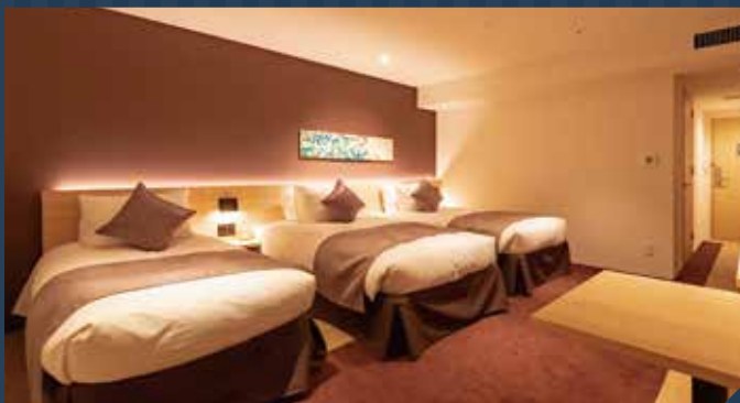
■デラックスツインルーム