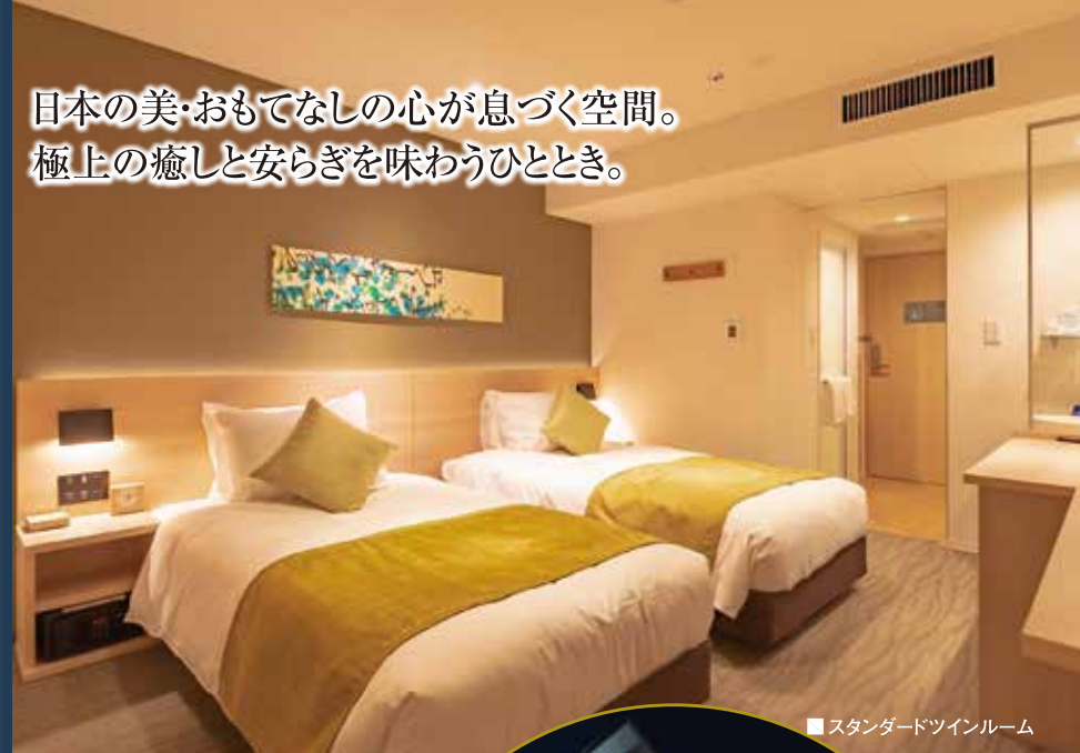
■スタンダードツインルーム