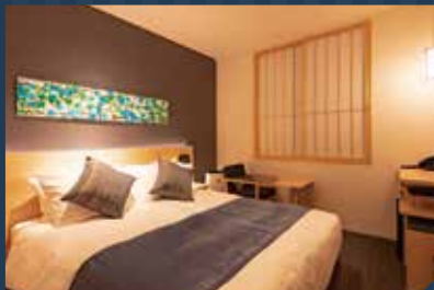
■スタンダードダブルルーム