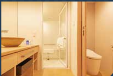
■バスルーム(全部屋洗い場付)