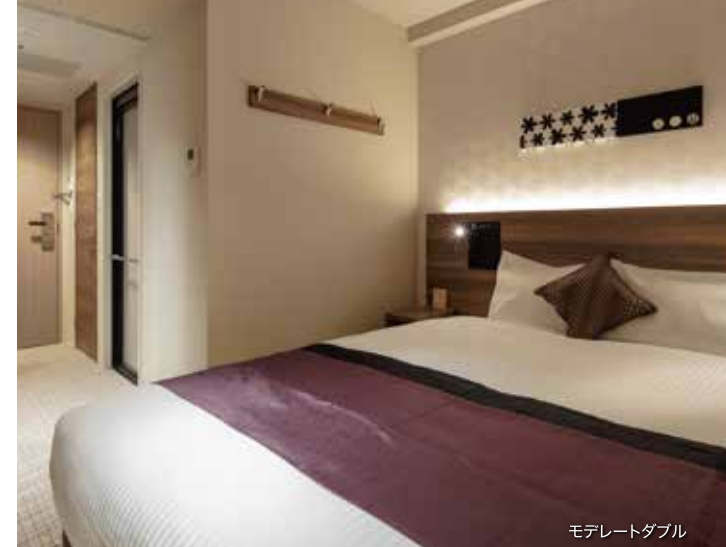
モデレートダブル

客室タイプ(全143室) ●チェックイン 15:00 チェックアウト 11:00