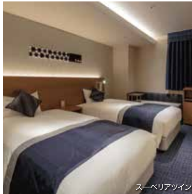
スーペリアツイン